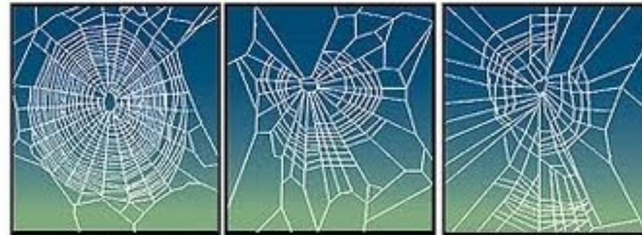
Normal (no chemical)